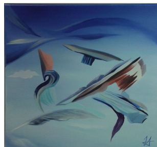
Daniel Pierre dit Hubert, Série des bleus musicaux, Huile sur toile, 40x40cm