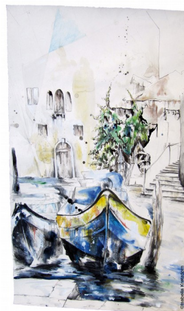
Isabella KRETZDORN, Venitian Impressions, Aquarelle, encre de chine, crayons de couleur sur papier, 41x59,8cm