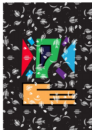
Smail Kanoute, Amitié, Impression off set sur papier 250g, 50x65cm